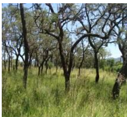
Foto 2.2.1-6 - Ambiente antropizado com regeneração de espécies de Cerrado sobre matriz herbácea exótica no município de Bragança Paulista. Coordenadas 23K, 344084 E – 7461041 S.