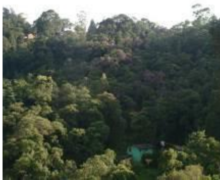
Foto 2.2.1-2 - Fragmento de Floresta Ombrófila Densa em estágio médio de regeneração no município de Mairiporã. Coordenadas: 23K, 341590 E - 7417005 S.