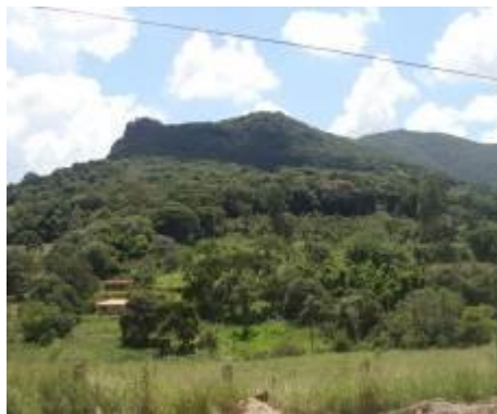
Foto 2.2.1-3 - Floresta Estacional Semidecidual em estágio médio de regeneração no município de Vargem. Coordenadas: 23K, 358926 E - 7463955 S.