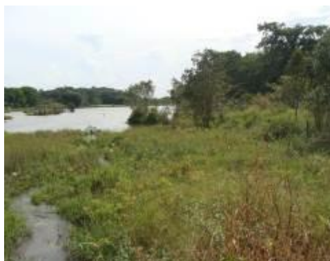
Foto 2.2.1-5 - Várzea antropizada em estágio pioneiro de regeneração no município de Holambra. Coordenadas: 23K, 291559 E-7495910 S.