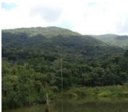
Foto 2.2.1-4 - Floresta Estacional Semidecidual em estágio médio de regeneração no município de Vargem. Coordenadas: 23K, 360308 E - 7464322 S.